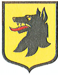
Commune de Corbeyrier